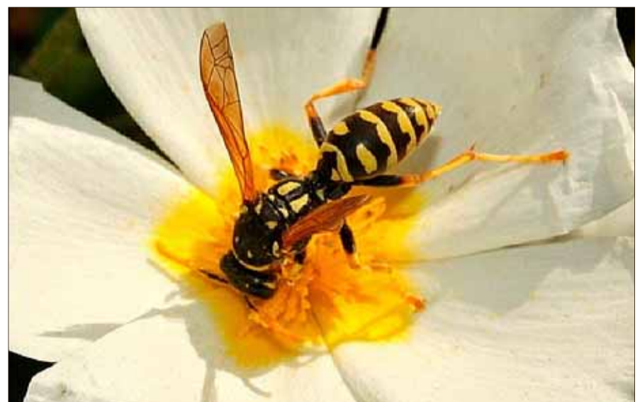
'Polistes dominula' (avispa cartonera), un himenóptero apócrito de la familia Vespidae.