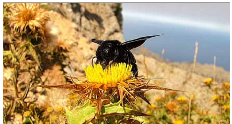
'Xylocopa violacea', el mayor abejorro europeo, visita un cardo en el Puig Major.