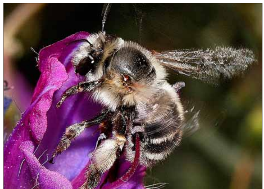
'Anthophora balearica' visita la planta 'Echium sabulicola'.