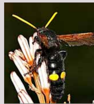
'Amegilla savignyi', 'Osmia balearica' y 'Megascolia bidens', tres polinizadores de Baleares. POLINIB

mas y agroecosistemas, ya que más del 75% de los cultivos dependen de animales para su polinización».